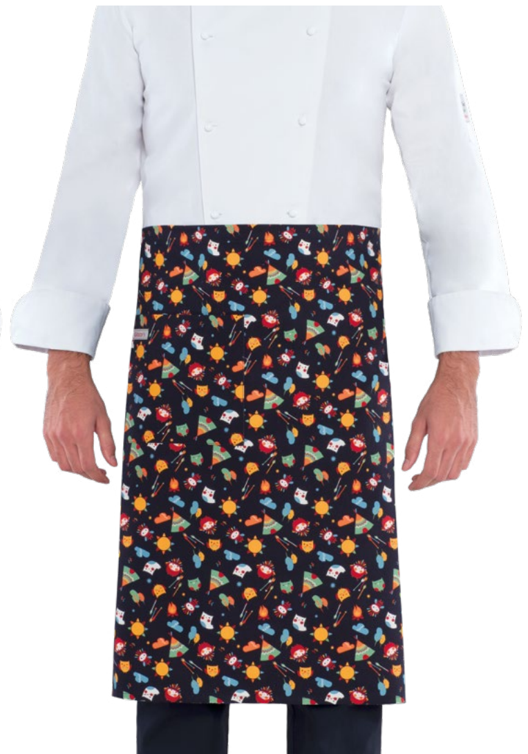
F013 Gufi indiani